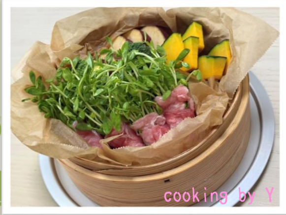
cooking by Y