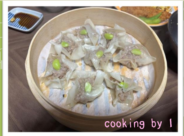
cooking by I

せいろで蒸し料理をすると、食材にじんわりと火が通り、 うまみが引き出されます。 また、栄養分が失われづらくみずみずしく仕上がります。 シュウマイなども意外と簡単に作れるので、 せいろがあると料理のレパートリーが増えておすすめです！